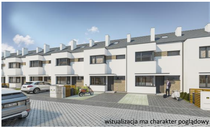
wizualizacja ma charakter poglądowy