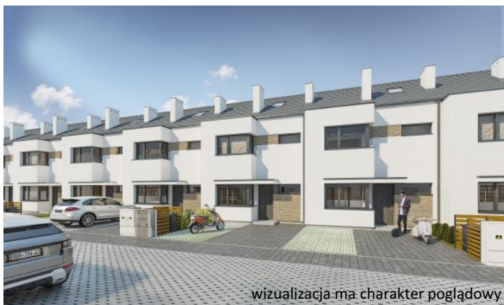
wizualizacja ma charakter poglądowy