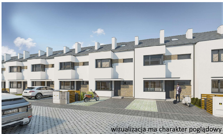
wizualizacja ma charakter poglądowy